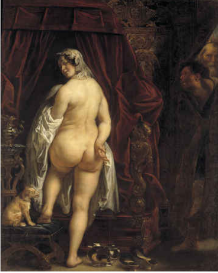
Imatge 1. Jacob Jordaens, Candaules, rey de Lidia, muestra su mujer al primer ministro Giges , 1648.