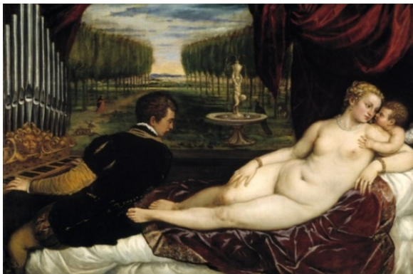
Imatge 3. Tiziano, Venus con el Amor y la música , 1548.