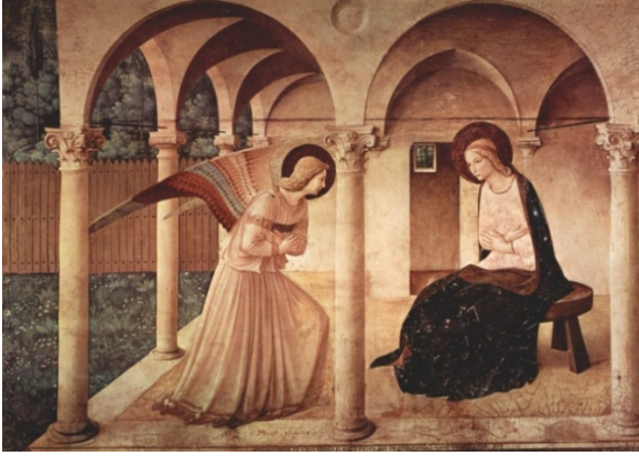
Imatge 7. Fra Angelico, La anunciación , 1437.