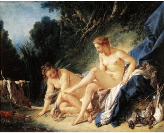
Imatge 2. François Boucher, Diana después de su baño , 1742.