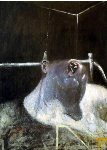
Imatge 5. Francis Bacon, Cabeza 1 , 1948.