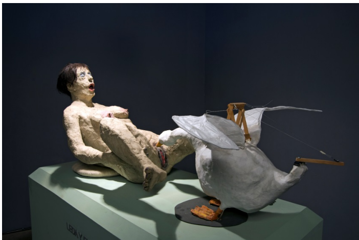
Fig. 2 — Papeles ordinarios : «Leda y el cisne», Instalación Factoría, Universidad ARCIS, 2005.