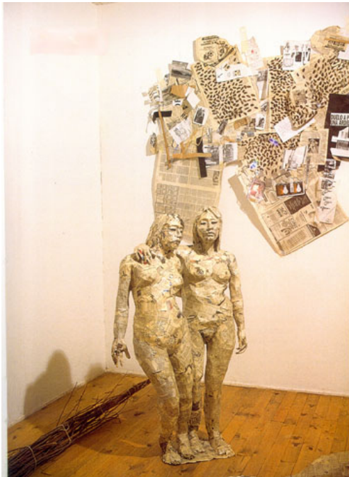
Fig. 1 — Juan Pablo Langlois: Miss Universal Destiny . Estudios Taller de Paine, 1996

honra al cuerpo que permanece, al individuo y a la personalidad. La puesta en escena de los distintos elementos impulsa vínculos, relaciones, analogías, oposiciones de formas anatómicas, sensibles, de coexistencia. Entender la mutación como clave productiva de las obras de Langlois pone de relieve la incesante reelaboración de agenciamientos múltiples entre elementos y obras que se vuelven a situar en nuevos contextos, engendrando renovados intercambios de sentido, de emociones y de afectos.