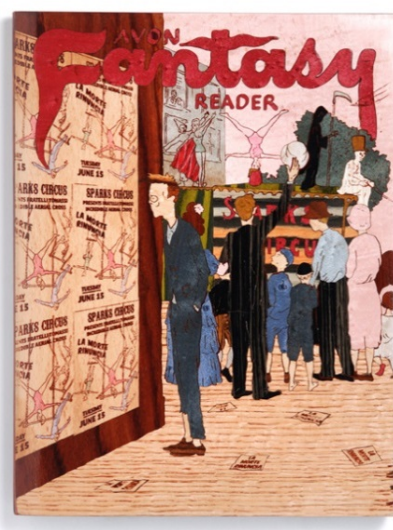
Fig. 4 — Avon Fantasy Reader Nro. 9. (2008) Marquetería laqueada sobre madera tallada | 20 x 26 cm

En este recorrido por Langlois, Meruane y Gordin, los cuerpos multiplicados aluden claves variadas: el regreso de lo expulsado, tecnologías de la mutación y de la reproducción, las manipulaciones médico-genéticas y la espectacularización contemporánea. La comemadre , novela que Roque Larraquy publica en 2010, anima oportunamente estas mismas dimensiones en la construcción de mundos de la reproductibilidad y de la espectacularización de sí, también de las economías ampliadas y de la porosidad del pasado en el presente.