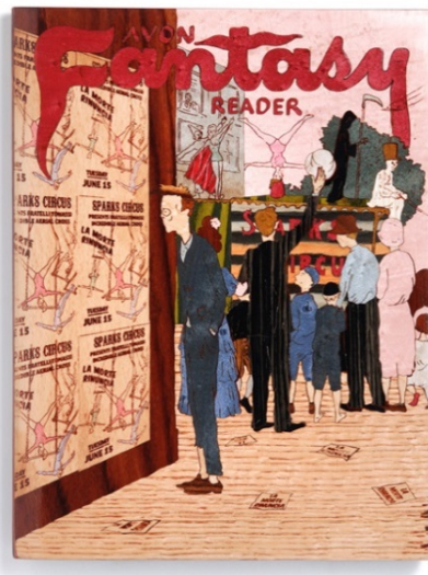
Fig. 4 — Avon Fantasy Reader Nro. 9. (2008) Marquetería laqueada sobre madera tallada | 20 x 26 cm

En este recorrido por Langlois, Meruane y Gordin, los cuerpos multiplicados aluden claves variadas: el regreso de lo expulsado, tecnologías de la mutación y de la reproducción, las manipulaciones médico-genéticas y la espectacularización contemporánea. La comemadre , novela que Roque Larraquy publica en 2010, anima oportunamente estas mismas dimensiones en la construcción de mundos de la reproductibilidad y de la espectacularización de sí, también de las economías ampliadas y de la porosidad del pasado en el presente.