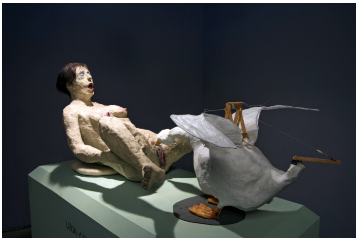
Fig. 2 — Papeles ordinarios : «Leda y el cisne», Instalación Factoría, Universidad ARCIS, 2005.

El previsible deterioro de estas obras difíciles de proteger motiva el siguiente proyecto de Langlois: cuatro obras en formato video, en stop motion , que realiza Nicolás Superby, en donde los cuerpos de papel se desarmen. Para hacer la filmación, las obras se destruyen, y es esta destrucción la que habilita la obra fílmica. Nótese que Langlois renuncia a intervenir los materiales de papel para alargarles la vida, de modo tal que declina una forma de conservación que prioriza la detención y la persistencia. Apuesta, por el contrario, a la trascendencia de la fugacidad, al registro de la mutación. El objeto artístico inicial desaparece y perdura el objeto fílmico de su destrucción, un devenir que se convierte en obra. Aquí, la condición del trabajo artístico es la mutación de materiales, de escultura en papel a formato digital, pero sobre todo hay un renovado compromiso a favor del orden de lo que muta.